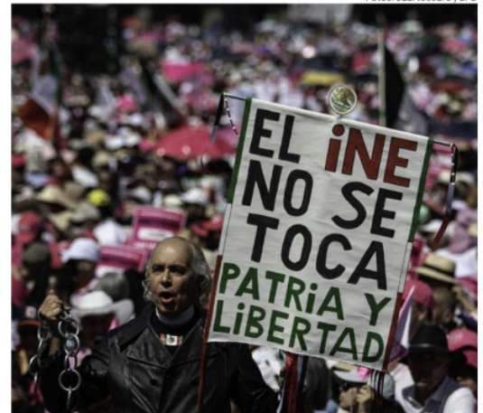
Un manifestante disfrazado de Miguel Hidalgo, rumbo al Zócalo.