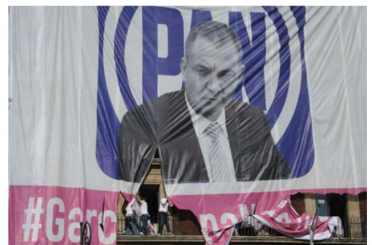
Una mega lona que buscaba provocar a los manifestantes fue retirada por los mismos.