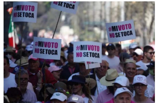
La marea rosa hizo escuchar su voz.