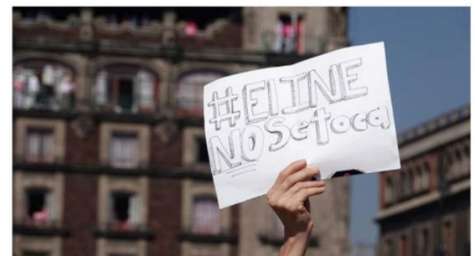
La defensa del INE convocó a decenas de miles de ciudadanos.