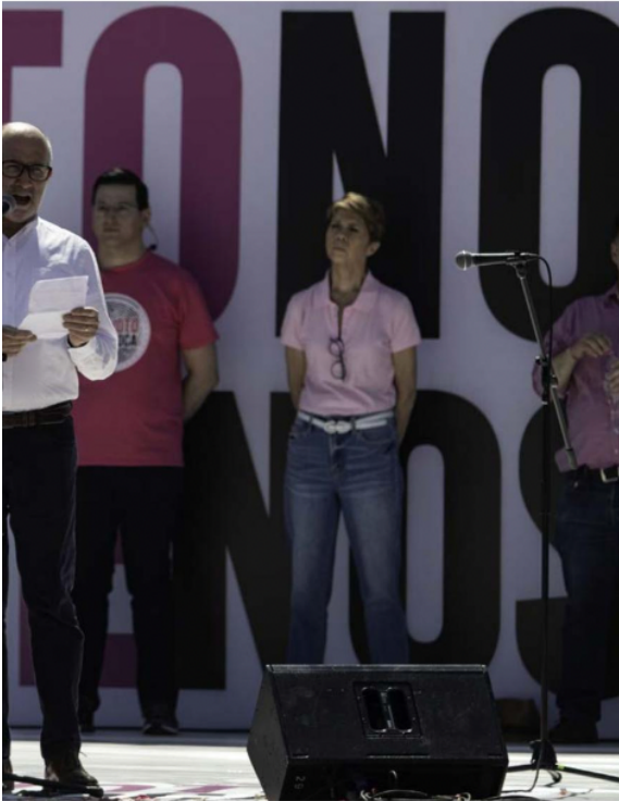
El exministro José Ramón Cossío fue el principal orador en la concentración en el Zócalo.