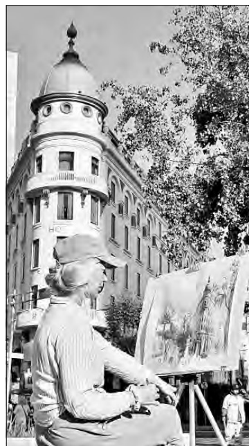
▲ Sobre Paseo de la Reforma, una artista dibuja a lápiz el edificio clásico de un hotel.