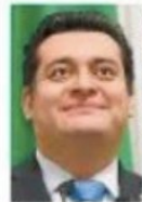
NOVO EL UNIVERSAL

==== Nos cuentan que las comisiones unidas de Puntos Constitucionales e Iniciativas Ciudadanas y de Administración Pública Local del Congreso de la Ciudad de México dieron entrada a una iniciativa ciudadana que busca