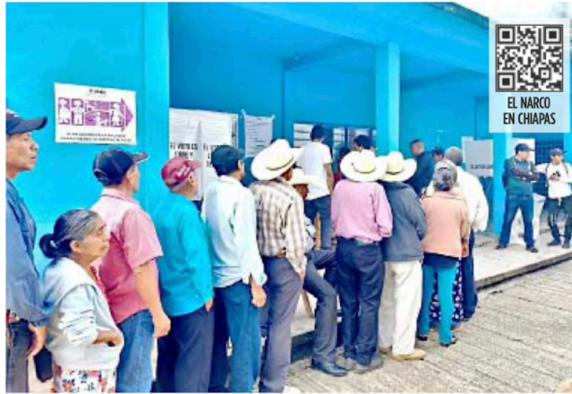
De acuerdo con las autoridades, la jornada electoral en los municipios chiapanecos de Capitán Luis Ángel Vidal y Chicomuselo transcurrió sin incidentes.