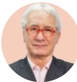
POR JAVIER SOLÓRZANO ZINSER