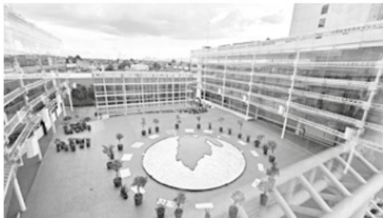
Seis áreas de atención del IEEM cuentan con certificaciones de empresas internacionales.

La UTAPE está avalada con la certificación ISO 9001:2015 que fue otorgada por el American Trust Register, S.C., y valida sus procesos de reclutamiento, evaluación, selección y