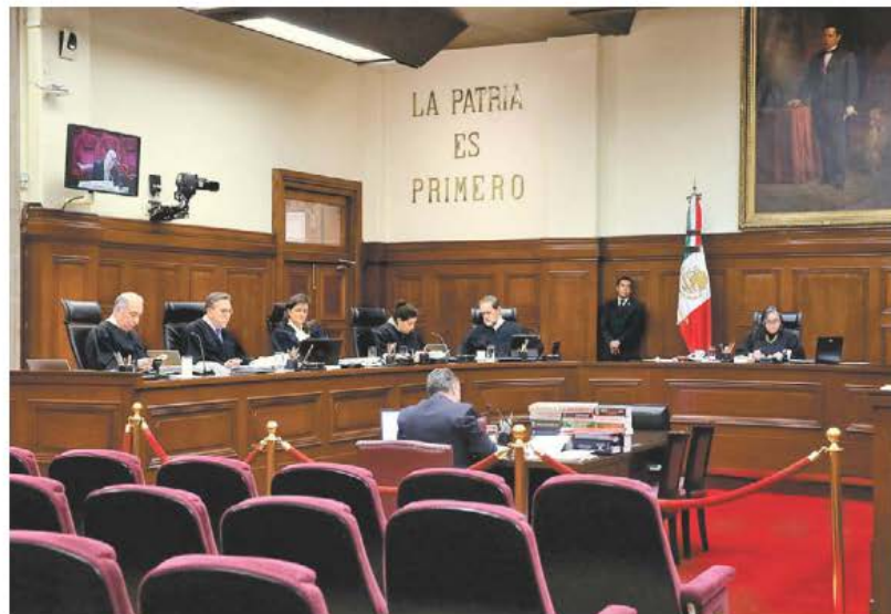
Sesión de ayer en el máximo tribunal de México.

Si bien es altamente probable que con la reforma del Poder Judicial Federal ganen, como se ha hecho costumbre desde 2018, los relatos del Presidente y sus mayorías, conviene reflexionar sobre algunas de las condiciones que harían posible abrirle un espacio a las razones. Resulta importante hacerlo por el carácter refundacional de la reforma propuesta y sus potencialmente mayúsculos impactos sobre nuestra