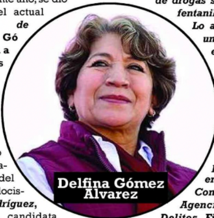
Delfina Gómez Álvarez

Álvarez , en tanto no se esclarezcan los hechos que se le imputan.