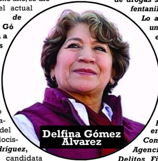
Delfina Gómez Álvarez

Álvarez , en tanto no se esclarezcan los hechos que se le imputan.