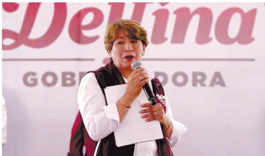
Rehabilitar y reordenar redes de distribución de agua propuso Delfina Gómez.

“Desde el año 2020 se han producido una serie de reducciones en el abasto de agua en todo el estado. Solo en agosto de 2022 se informó que se reducirían los 400 litros de agua por segundo que recibía la Comisión del Agua del Estado de México (CAEM),