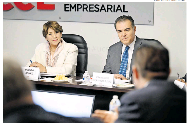
Delfina Gómez propuso incrementar el número de elementos de seguridad.

Así como el fortalecimiento del programa de apertura de negocios en la entidad mexiquense mediante la digitalización del 100% de los trámites, propuestas explicadas a las y los empresarios del CCE durante la reunión.