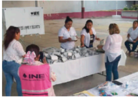
FUNCIONARIAS DE casilla cuentan los votos en Chignahuapan, el domingo.

A su vez, el dirigente del PRI en Puebla, Néstor Camarillo, aseguró que presentará