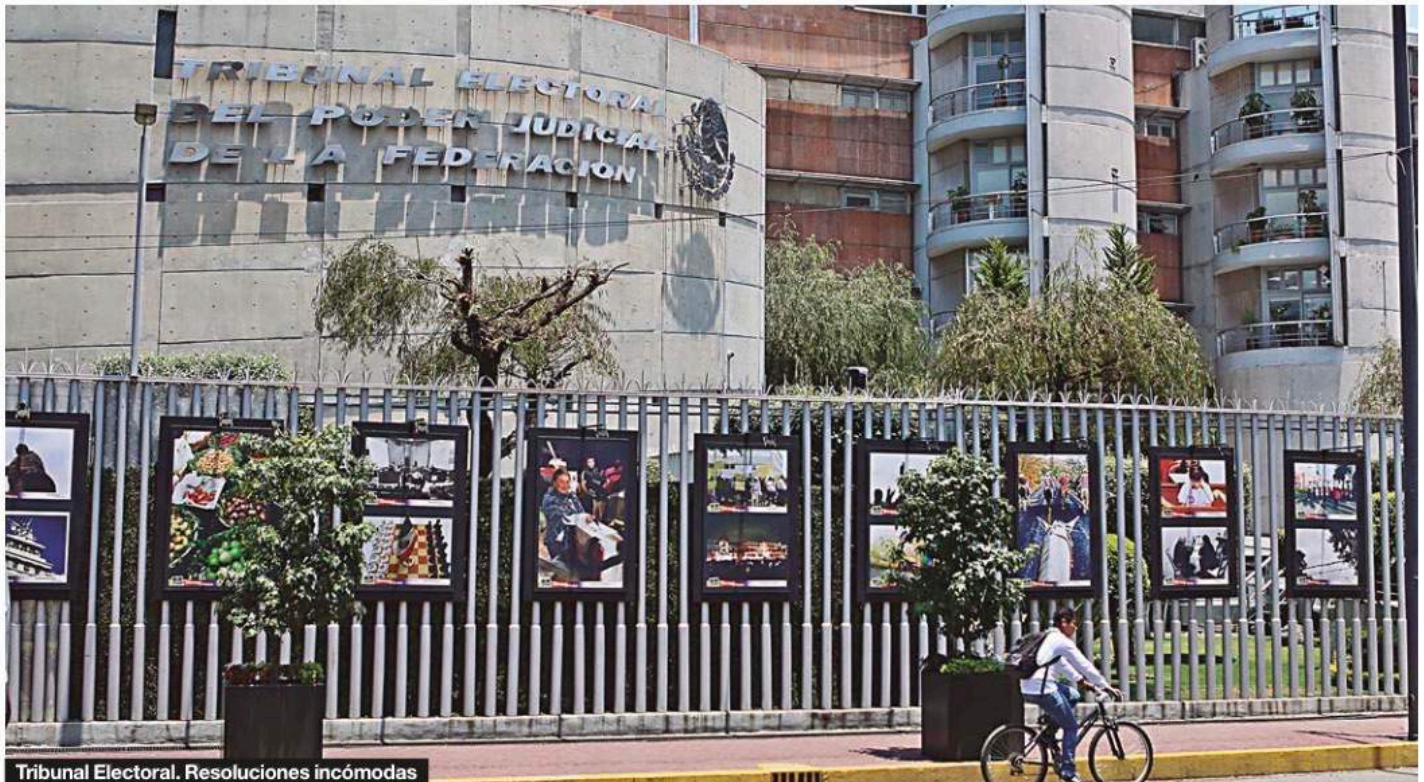
Tribunal Electoral. Resoluciones incómodas