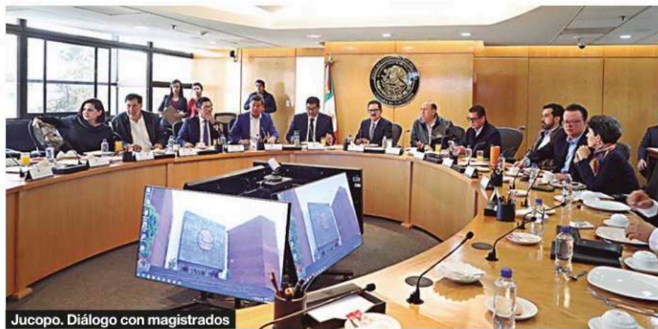
Jucopo. Diálogo con magistrados

Aunque hubo enorme énfasis en que la reunión no era para negociar las reso-