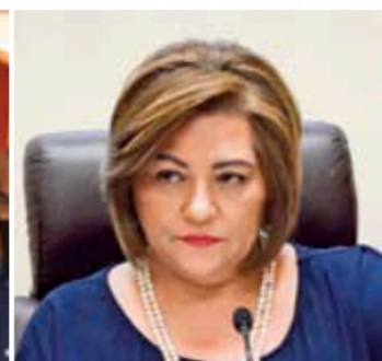
Guadalupe Taddei Zavala, expresidenta del Instituto Electoral de Sonora y comisionada del Instituto de Transparencia en la entidad.