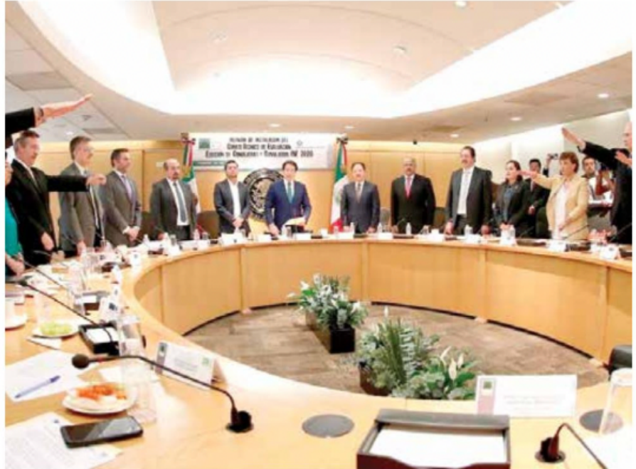
• CALENDARIO. Hoy se entregan a la Jucopo de San Lázaro las cuatro quintetas.

• Faltan nueve días para que tomen posesión los cuatro nuevos consejeros.