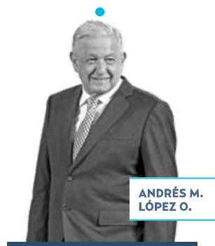
ANDRÉS M. LÓPEZ O.

Este fin de semana, desde Sonora, el presiden- te Andrés Manuel López Obrador confió en que "todo pinta" para que continúe la llamada Cuarta Transformación del país y el proyecto del gobier- no que protege a los po- bres. Ante el pueblo Yaqui, el jefe del Ejecutivo fede- ral pidió a la población estar tranquilos porque no habrá retrocesos, ya que la gente sabrá defender en las urnas el movimiento que encabeza, aseguró el mandatario.