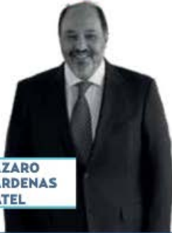
LÁZARO CÁRDENAS BATEL

► Nueva encomienda asignó la presidenta Claudia Sheinbaum al jefe de la Oficina de la Presidencia, Lázaro Cárdenas Batel . Ayer en Juxtlahuaca, Oaxaca, lo puso al frente de la Comisión del general Lázaro Cárdenas del Río, con la que se atenderá a la región Mixteca. Se coordinará con los titulares de Bienestar Ariadna Montiel ; de Comunicaciones, Jesús Esteva ; de Educación, Mario Delgado ; y el gobernador Salomón Jara , para solucionar demandas de las comunidades.