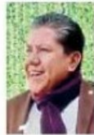
David Monreal Ávila

El que anda con los villancicos al 1000% en Zacatecas, nos platican, es el gobernador David Monreal Ávila (Morena), pues presumió en redes sociales la colocación del árbol