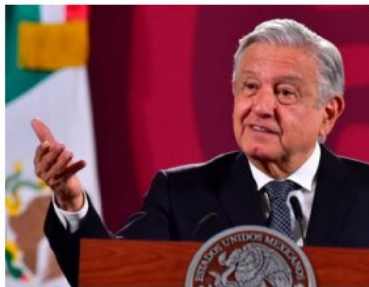
López Obrador convocó a una marcha el próximo domingo.

El éxito de la marcha en defensa del INE, el hecho de que hayan participado en la CDMX y en otras plazas ciudadanos de todos los partidos opositores, provocó que la 4T resolviera poner toda la carne en el asador para enviar el mensaje de que si los quieren sacar del gobierno tendrán que derrotarlos en las calles, no solo en las urnas. Sin AMLO en la boleta