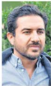
Miguel Ángel Yunes Márquez

::::: Ayer se conoció uno de los premios a los que se hizo acreedor Miguel Ángel Yunes Márquez en el Senado por haber votado a favor de la reforma judicial: ser secretario de una de las comisiones más importantes de la cámara alta, la de Justicia. En este espacio le dimos a conocer que