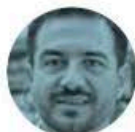
MIGUEL ÁNGEL YUNES MÁRQUEZ

› Reunión para impulsar proyectos de desarrollo en Guerrero sostuvieron Lázaro Cárdenas Batel , próximo jefe de la Oficina de la presidenta electa, Claudia Sheinbaum , y el ex gobernador de la entidad Ángel Aguirre . Éste último difundió el encuentro y refrendó su respaldo a quien será, a partir del 1 de octubre, la primera presidenta de México.