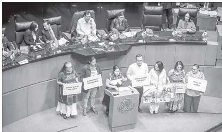
▲ La reforma que da reconocimiento constitucional a derechos de los pueblos