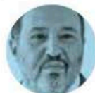
LÁZARO CÁRDENAS BATEL

› Hace agua el liderazgo del gobernador de Coahuila, Manolo Jiménez , luego de que el alcalde de Torreón, Román Cepeda , también priista, decretó que el Grupo de Reacción Torreón sólo opere con policías municipales y bajo su mando. En Palacio de Gobierno trastabillan con el tema, porque saben que ya se le subieron a las barbas.