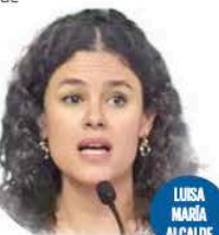
LUISA MARÍA ALCALDE

Sheinbaum heredará de Andrés Manuel López Obrador .