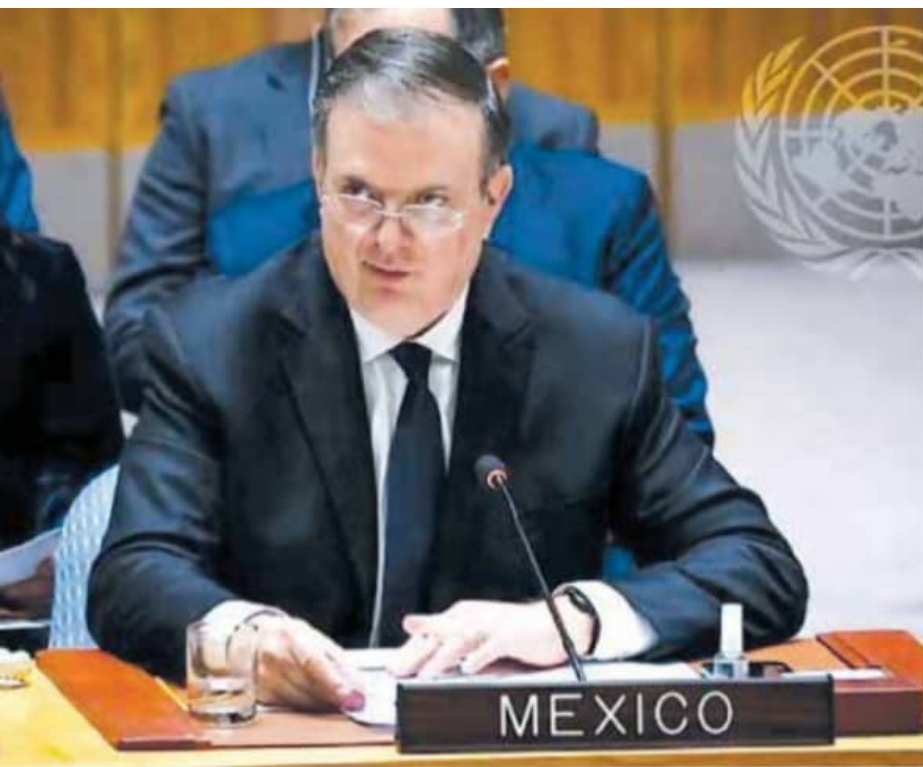
Ebrard | No cerrar la puerta a la diplomacia.

Ebrard denunció que es preocupante la dimensión del riesgo nuclear por los enfrentamientos alrededor de la planta nuclear de Zaporíyia en Ucrania (la más grande de Europa). "Asegurar su integridad y buen funcionamiento es crítico para evitar la peor de las catástrofes posibles. Respalamos las recomendaciones formuladas por el Organismo Internacional de Energía Atómica (OIEA) tras su inspección técnica, las cuales deben ser acatadas de inmediato, y apoyamos los llamados para crear un perímetro de seguridad alrededor de la planta".