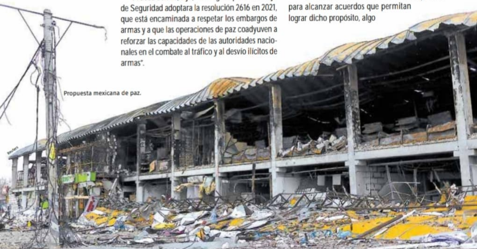
Propuesta mexicana de paz.

“México lamenta la falta de voluntad política para alcanzar acuerdos que permitan lograr dicho propósito, algo