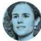
LUISA MARÍA ALCALDE

➤ Resulta que el primer recorrido de supervisión del Tren Maya será en petit comité . Este 1 de septiembre, el reducido grupo de personajes que subirá a la obra emblemática de la 4T estará encabezado por el presidente López Obrador . Lo acompañarán las gobernadoras de Campeche, Layda Sansores , y de Quintana Roo, Mara Lezama , además del mandatario de Yucatán, Mauricio Vila , y el magnate Carlos Slim , cuyas empresas participan en la obra.