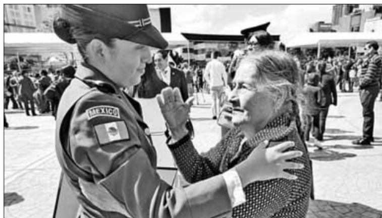
▲ El titular de la Sedena encabezó la ceremonia de graduación de 346 nuevos profesionales de la