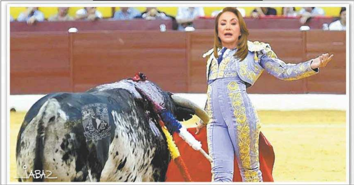
EL PAÍS DE NUNCA JABAZ/LA PLAGIARIA