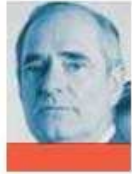
JULEN REMENTERÍA SENADOR DEL PAN @JULENREMENTERIA