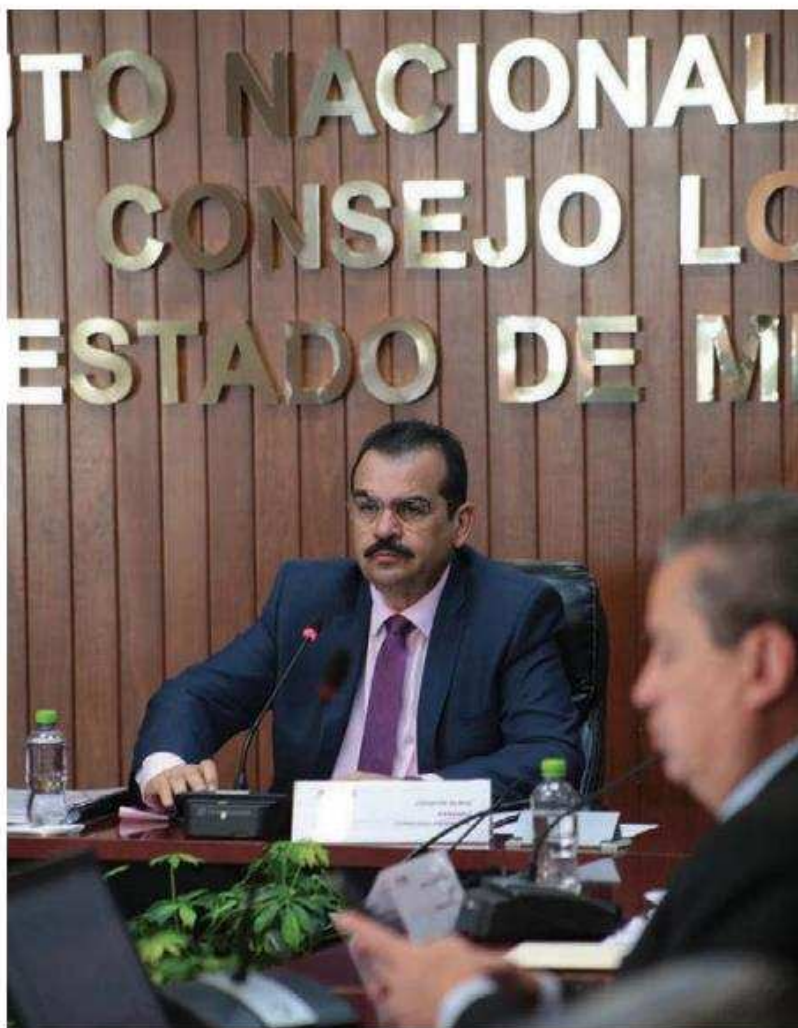
Junta Local del INE atiende solicitudes. TANIA CONTRERAS

El vocal aseguró que el grado de peligrosidad se determina a partir del mapa que realizaron el INE y las autoridades de seguridad federales y estatales, donde