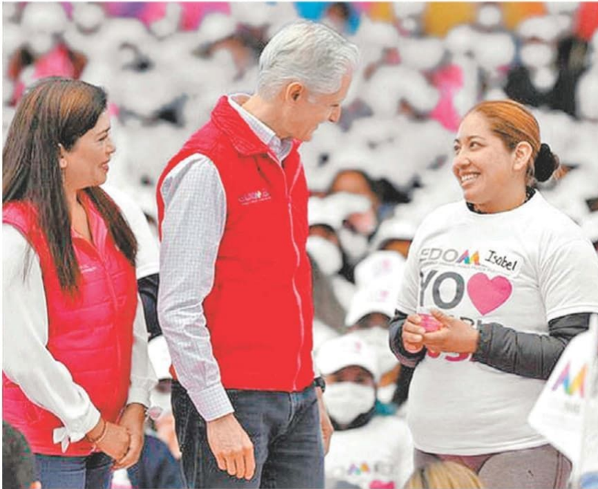
El gobernador Alfredo del Mazo en un acto de apoyo a las mujeres.

graron añadir a 66 mil a las listas de este programa de transferencia de recursos sin intermediarios, como lo hace el gobierno federal con las tarjetas del Bienestar.