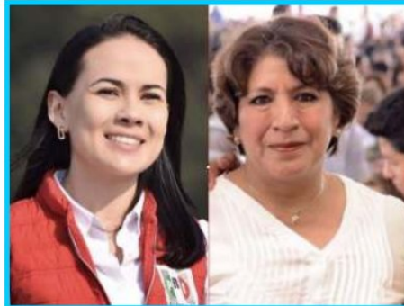
Coahuila y en el Estado de México.

Claro que mientras esto pasa por fuera, entre bambalinas parece indicar que las estrellas se están alineando para que el PRI retenga la gubernatura de Coahuila, pues actualmente Hay un gobernador popular que ha entregado buenos resultados, sobre todo en materia de seguridad. y si a eso le agregamos que "Miguel Riquelme" es uno de los mejores operadores electorales de todos los mandatarios estatales del país, como quedó demostrado al ganar en el año 2021 cinco de los siete distritos federales que estaban en juego y además, se llevó 25 de las 38 alcaldías del estado. Nada mal, sobre todo para un partido que se decía estaba en franca decadencia a nivel nacional.