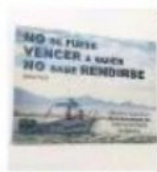
Frase difundida por la Marina

==== Desde que llegó el beisbol como deporte nacional, todo son batazos. Nos comentan que además de plasmar frases del presidente Andrés Manuel López Obrador en las instalaciones de las Fuerzas Armadas, la Secretaría de Marina ha sumado una nueva frase inspiradora, que no es precisamente del comandante en jefe de las