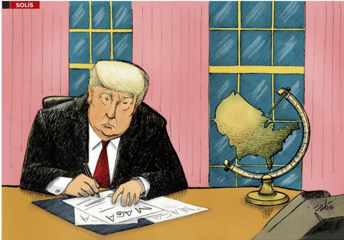
El mundo de acuerdo a uno de los candidatos