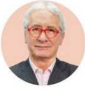
POR JAVIER SOLÓRZANO ZINSER

solorzano52mx@ yahoo.com.mx @JavierSolorzano