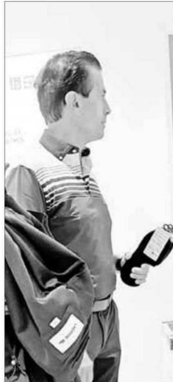
▲ El ex presidente Enrique Peña Nieto fue captado de compras en la tienda de moda Uniqlo en Madrid, España. Las imágenes compartidas en redes sociodigitales se han vuelto virales; muestran con calcetines en la mano al ex mandatario, quien viste una playera tipo polo.