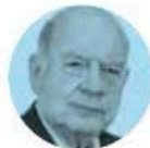
JOSÉ MIGUEL INSULZA

► Hablando de la FGR, en cuestión de días el INE, presidido por Guadalupe Taddei , interpondrá una denuncia penal por irregularidades en tres mil 355 solicitudes de voto en el exterior. Y es que hallaron comprobantes de domicilio falsos y firmas apócrifas, lo cual podría constituir un delito electoral. Creen que hay mano negra en esos registros.