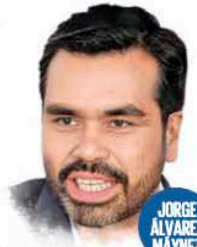
JORGE ÁLVAREZ MÁYNEZ