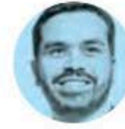
JORGE ÁLVAREZ MÁYNEZ

► Resulta que también en la Corte, presidida por Norma Piña , están esperando a que pasen las elecciones presidenciales para retomar temas espinosos, como el fallo sobre los fideicomisos. Los ministros, nos dicen, argumentan en corto que no se quiere meter más ruido al proceso, así que esperarán a que hablen las urnas.