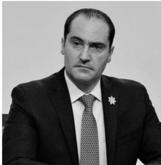
Rodrigo Martínez Celis-Wogau, titular de la SS del Estado de México.

El secretario de Seguridad informó que serán 12 mil 200 policías estatales los que serán desplegados el 4 de junio, los mismos dijo, tendrán acompañamiento de elementos de la Guardia Nacional, además del operativo en los C5 de Toluca y Ecatepec, donde estarán autoridades esta-