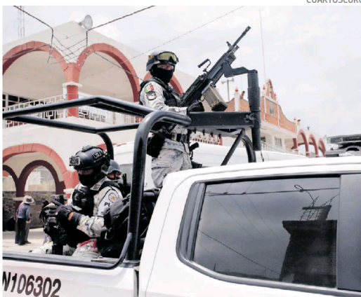
Guardia Nacional trabajará solamente en el proceso electoral