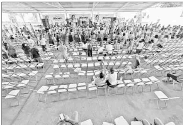
▲ La candidata opositora anunció un cambio de estrategia para el debate del próximo domingo.