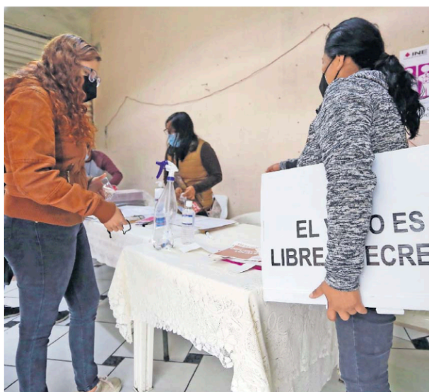
La elección del año pasado fue en la que se registraron más víctimas de violencia político-electoral, con 656 personas e instalaciones atacadas, de acuerdo con México Evalúa.