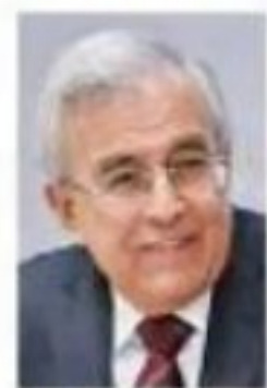
Rubén Rocha Moya

==== El que está padeciendo en carne propia la burocracia federal en Sinaloa, nos comentan, es el gobernador Rubén Rocha Moya (Morena), pues "trae atravesado" al titular del Instituto de Salud para el Bienestar (Insabi), Juan Ferrer Aguilar (Morena).