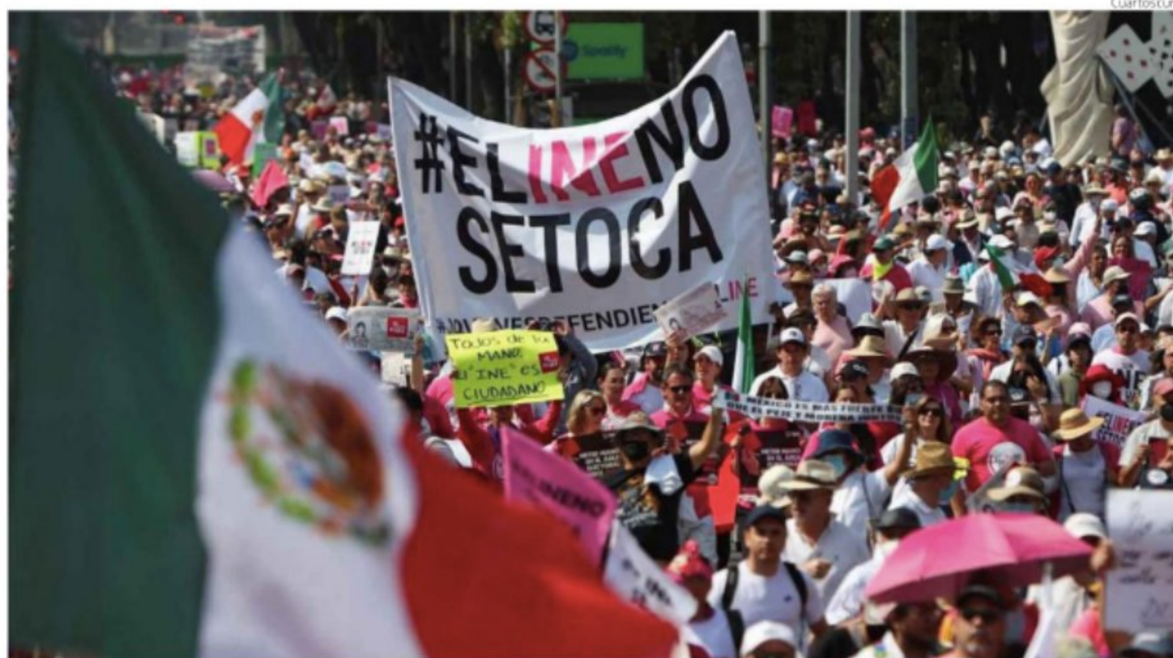
La marcha en defensa del INE reunió a 840 mil personas en la Ciudad de México, según estimaciones de Google, sin tomar en cuenta que hubo marchas en más de 50 ciudades de México, Estados Unidos y Europa.

Luego de cinco días de rumiar su furia contra los organizadores y participantes en la megamarcha, se le ocurrió organizar una contramarcha o una marcha de la venganza: "esto no se va a quedar así", "me la van a pagar", "van a ver de lo que soy capaz". López Obrador convocó a una marcha que encabezará él mismo. Esta se llevará a cabo el domingo 27 de noviembre, dizque para conmemorar su cuarto año de gobierno y rendir su informe anual de labores. Informe que, en realidad debería darse el 1 de diciembre fecha en que