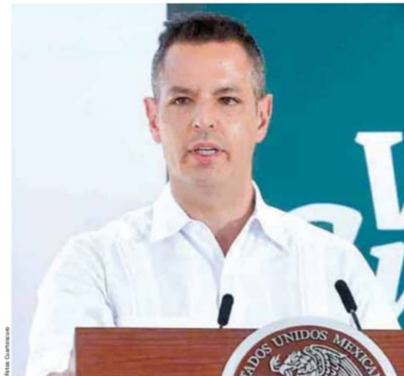
Murat | Desarrollo.

“El México del futuro se construye por una conjunción de ideales y objetivos”.