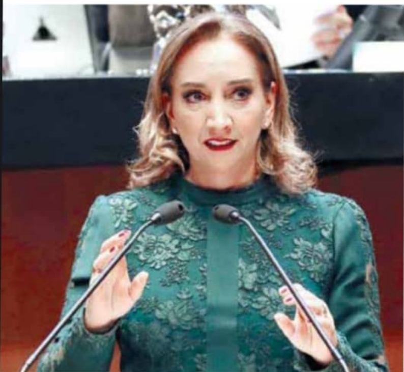
Ruiz Massieu | Valor.