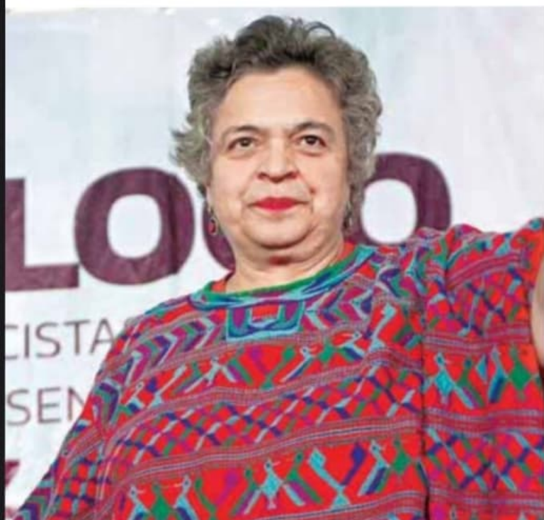
Paredes | Estabilidad.