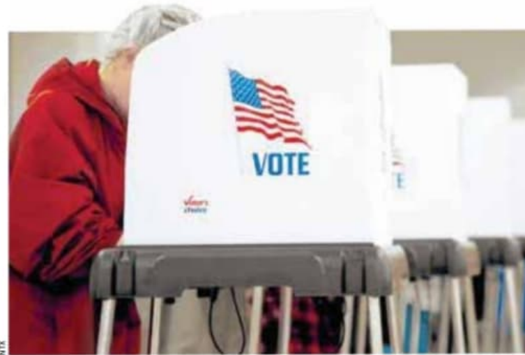
Enorme interés hacia el futuro.

Muestra de esta reiteración son los testimonios de Kari Lake, republicana y relevante protagonista en la Conferencia Política de Acción Conservadora; del gobernador de Florida, Ron DeSantis; o del propio Mark Finchem, quien podría elegirse como fiscal general de