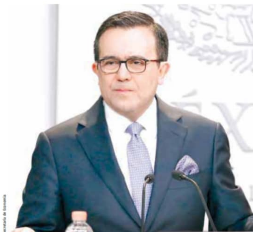
Guajardo | Instituciones.

Abundó: “El Estado debe representar el interés de todos, que la justicia sea accesible, empoderar a los jóvenes y replantear la relación con la sociedad civil”.