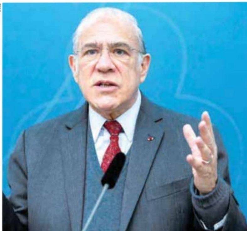
Gurría | Reconstrucción.

nuestra alianza no solo sea electoral y legislativa, sino gubernamental”.