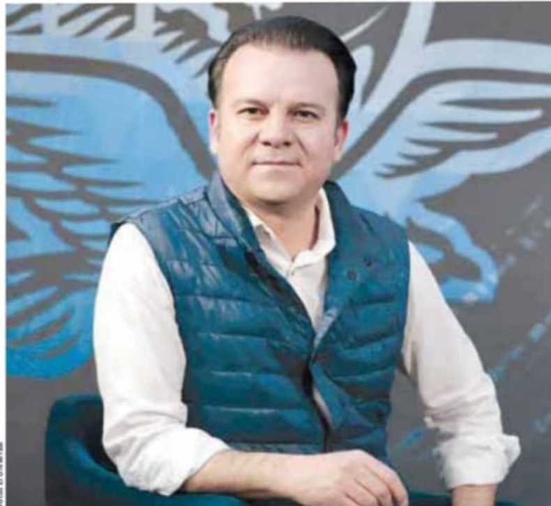
Villegas | Resultados.

Aceptó que “el PRI fue omiso y tolerante con los actos de corrupción”, además de que los gobiernos de su partido “no fueron capaces de reducir la brecha de desigualdad y de pobreza”.