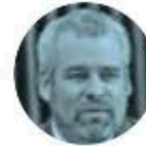
ALFREDO RAMÍREZ BEDOLLA

» La Coparmex, que preside José Medina Mora Icaza , expresó su rechazo a la reforma que permite el traspaso de la Guardia Nacional a las Fuerzas Armadas. Pidió la defensa de un México en el que la seguridad pública esté a cargo de instituciones civiles para asegurar la transparencia y el respeto a los derechos humanos.