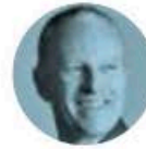
JOSÉ MEDINA MORA ICAZA

» La Fiscalía General de la República (FGR), encabezada por Alejandro Gertz Manero , desmanteló una organización dedicada al robo de menores de edad que operaba en Chiapas, Morelos y Puebla. Además, obtuvo vinculación a proceso en contra de tres personas por su probable responsabilidad en el delito de secuestro.