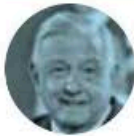
ANDRÉS M. LÓPEZ OBRADOR