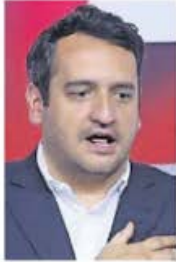
DIEGO SIMÓN EL UNIVERSAL

:::: Con la precisión de un reloj suizo, ayer Morena formalizó lo que todo el mundo sabía. Luisa