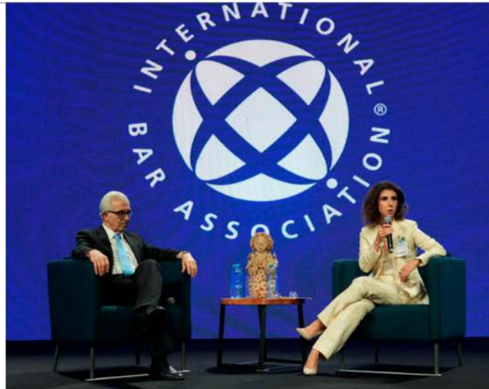
Ernesto Zedillo, ex presidente de México, en el discurso inaugural de la IBA

Sin embargo, hay algo en su diagnóstico con el que no puedo estar de acuerdo y que me parece, absolutamente cen-