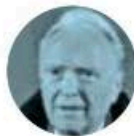
ALEJANDRO GERTZ MANERO

» Última misión tendrá la canciller, Alicia Bárcena . Llevará la representación de México en la semana de alto nivel de la 79 Asamblea General de Naciones Unidas. Ahí abordará temas prioritarios para el país, como la solución pacífica de controversias, migración, política exterior feminista, crisis climática, tráfico de drogas y armas, entre otros.