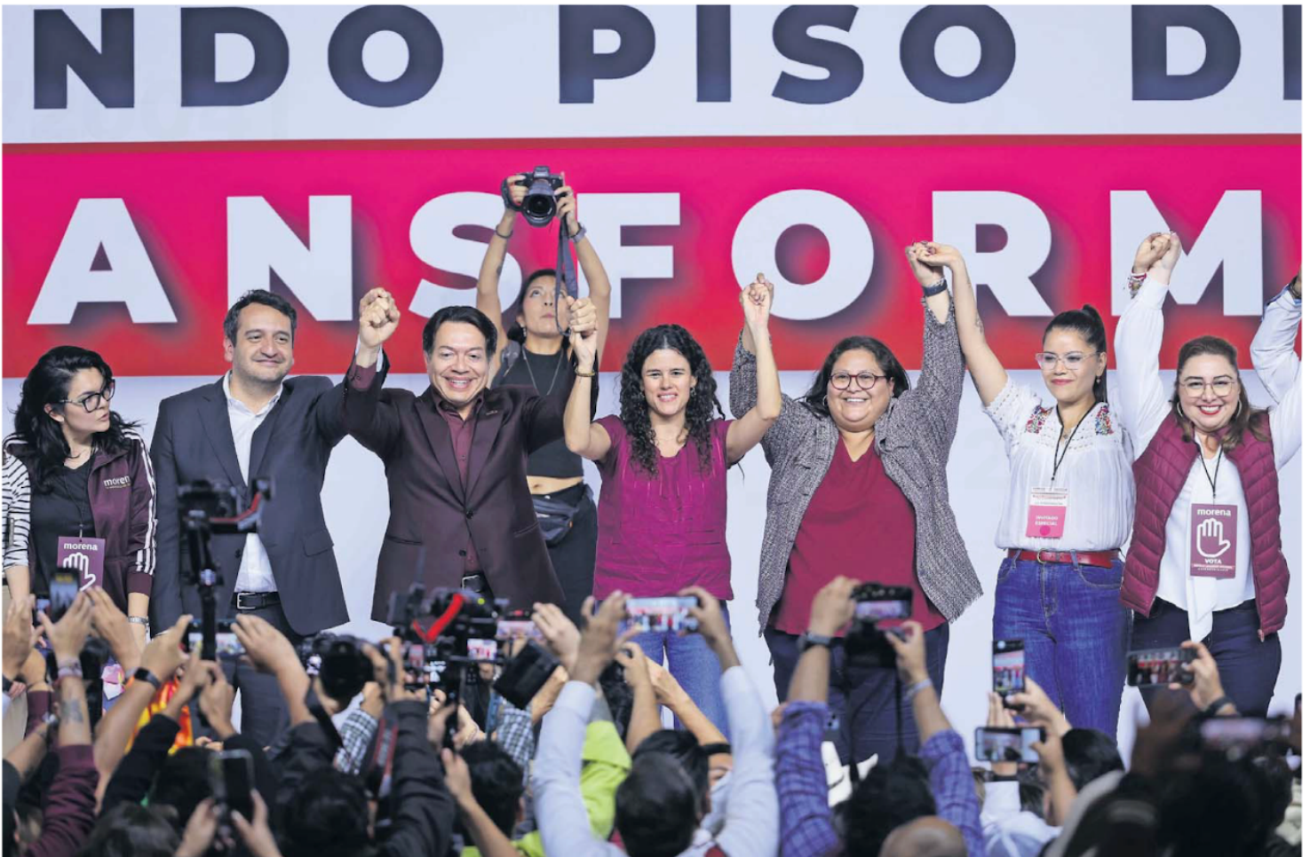
El Congreso Nacional de Morena festejó los nuevos nombramientos que buscan dar continuidad al legado de Andrés Manuel López Obrador.