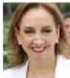
■ Claudia Ruiz Massieu