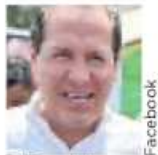
■ Eruviel Ávila