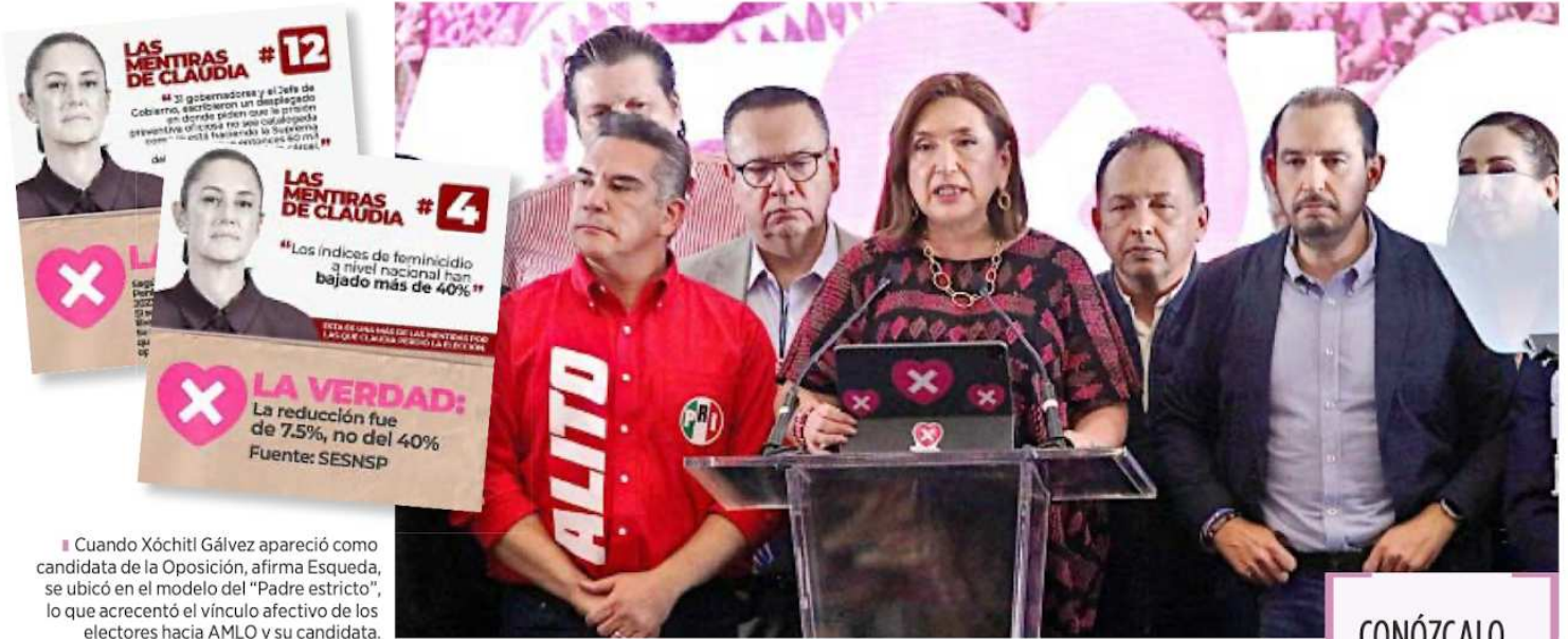
■ Cuando Xóchitl Gálvez apareció como candidata de la Oposición, afirma Esqueda, se ubicó en el modelo del "Padre estricto", lo que acrecentó el vínculo afectivo de los electores hacia AMLO y su candidata.