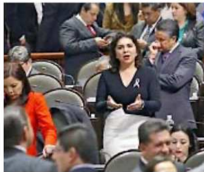
■ Por tercera ocasión, Ivonne Ortega estará en San Lázaro, después de ser senadora y Gobernadora de Yucatán.

Por ejemplo, de los nueve candidatos que ganaron una diputación de mayoría en Chihuahua, ocho son o fueron legisladores federales o locales; o en Nayarit, los tres ganadores también son diputados.