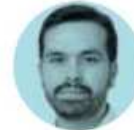
JORGE ÁLVAREZ MÁYNEZ

Pese a que varios lo mencionan como posible integrante del gabinete de Claudia Sheinbaum , el director del IMSS, Zoé Robledo , se mantiene al pie del cañón haciendo su trabajo. Ayer estuvo en Puebla, con el gobernador Sergio Salomón , ante quien destacó la inversión de más de $4 mil millones para infraestructura médica en la entidad.