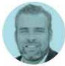
ALFREDO RAMÍREZ BEDOLLA

Comunicación constante tendrá el gobierno de EU con el equipo de la presidenta electa, Claudia Sheinbaum . Nos dicen que la llamada telefónica del secretario de Estado, Antony Blinken , al futuro canciller mexicano, Juan Ramón de la Fuente , es el inicio de una serie de charlas que sostendrán con personal del próximo gobierno federal. Para la Casa Blanca, al mando de Joe Biden , es muy importante esta relación, sobre todo de cara a la elección de noviembre, donde se juega la presidencia.