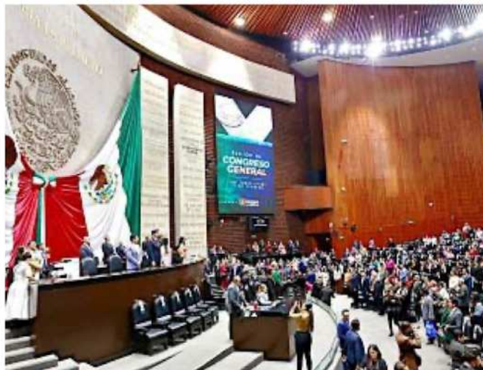
■ En comparación con las dos últimas legislaturas, en San Lázaro más de la mitad de los 500 diputados han sido una, dos, tres o hasta cuatro veces legisladores.