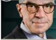
LUIS RUBIO @lrubiof

Con la transición viene un momento de gran tensión y riesgos, tanto por quienes lo lideran como por las agendas e intereses.