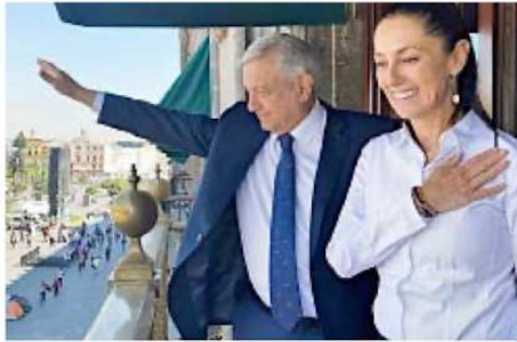
■ Para el experto, AMLO ha construido su imagen pública con base en el marco llamado "Padre cariñoso" y Claudia Sheinbaum puede generar un vínculo emocional más fuerte como la "Madre cariñosa".

Los marcos cognitivos, según algunos científicos cognitivos, son entre otras cosas, sistemas de conexiones neuronales subconscientes que nos permiten entender escenas, imágenes,