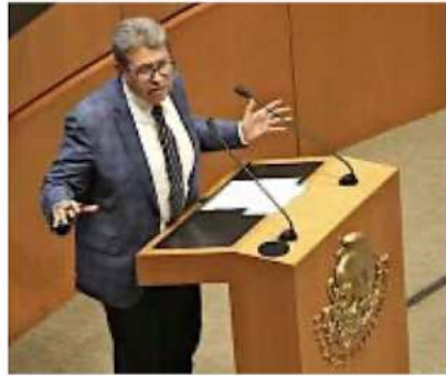
■ Una veintena de senadores brincaron de la Cámara alta a la baja. Algunos de ellos, como Ricardo Monreal, prácticamente toda su carrera política ha sido en el Congreso.

Entre ellos Ivonne Ortega, quien por tercera ocasión estará en San Lázaro, después de ser senadora y Gobernadora de Yucatán; el panista Jorge Romero que va por su segunda legislatura federal; el pevemista Carlos Puente, o el operador de Sheinbaum, Alfonso Ramírez Cuéllar, y el morenista Sergio Gutiérrez Luna.