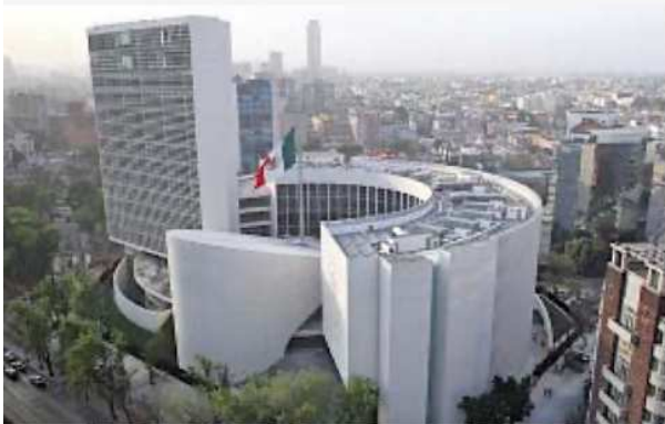
En la Cámara alta, Morena estaría a dos o tres senadores de alcanzar la mayoría calificada.

gunda o tercera senaduría o han sido varias veces diputados: Citlalli Hernández, dirigente de Morena que deberá dejar la dirigencia este año; Clemente Castañeda, de Mo-