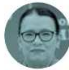
ROSA ICELA RODRÍGUEZ

Como adelantamos en este espacio ayer, Estados Unidos levantó la suspensión a la importación de aguacate y mango mexicanos. El gobernador de Michoacán, Alfredo Ramírez Bedolla , gestionó con el embajador Ken Salazar reanudar las exportaciones hacia nuestro vecino del norte, y el lunes se reúnen para hacerlo oficial.