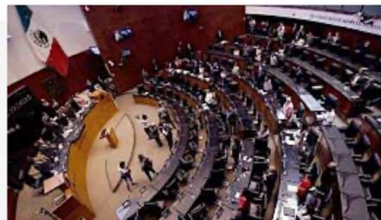
De los próximos 128 senadores, 20 no tienen ninguna experiencia legislativa, y el resto ya fue legislador federal o local.

También está un bloque intermedio, donde están políticos que van por su se-