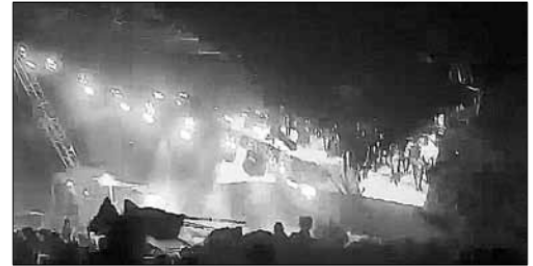
▲ Ocho muertos y al menos 63 heridos dejó el desplome del escenario donde anoche el candidato presidencial de MC, Jorge Álvarez Máñez, acompañaba a la aspirante a la alcaldía de San Pedro Garza García, NL, en su cierre de campaña.