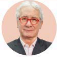
POR JAVIER SOLÓRZANO ZINSER