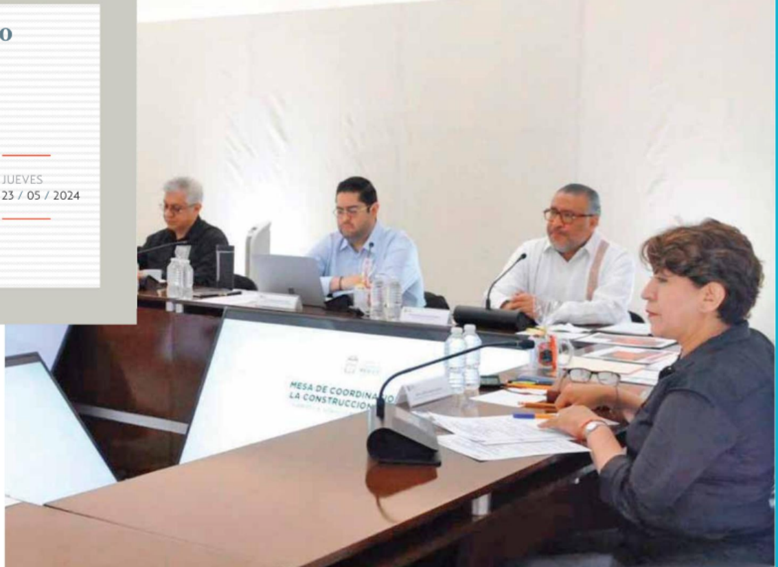
SEGUIMIENTO | • Delfina Gómez recibe diario un reporte sobre el estado de la seguridad en las campañas electorales.