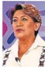
Delfina Gómez Álvarez

::::: Le platicamos que ayer la candidata de Morena-PT-PVEM al gobierno del Estado de México, Delfina Gómez , estuvo muy apapachada por las mujeres de la autollamada Cuarta Transformación. Primero, se dio a conocer que tuvo un desayuno con integrantes del gabinete de Andrés Manuel López Obrador , como las secretarías de Seguridad y Protección Ciudadana, Rosa Icela Rodríguez ; del Trabajo, Luisa María Alcalde ; de Educación Pública, Leticia Ramírez ; de Cultura, Alejandra Frausto , así como la senadora Olga Sánchez Cordero , quienes postearon en redes sociales el encuentro. Y por la tarde, la maestra acudió a un foro donde coincidió con la alcaldesa de Iztapalapa, Clara Brugada , a quien dijo respetar mucho, pero evitó hablar sobre corcholatas capitalinas. Así las cosas para doña Delfina, a dos semanas de la cita con las urnas.