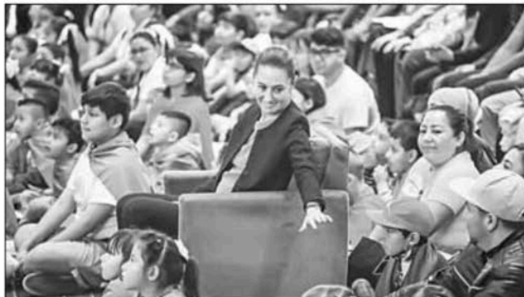
▲ Claudia Sheinbaum firmó ayer el pacto por la primera infancia, que consta de 12 metas y