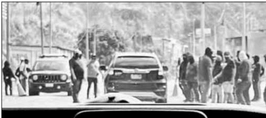
▲ Un grupo de encapuchados rodeó el domingo el vehículo de la candidata de la coalición Sigamos Haciendo Historia a la

X: @cafevega Correo: cfumexico_sa@hotmail.com