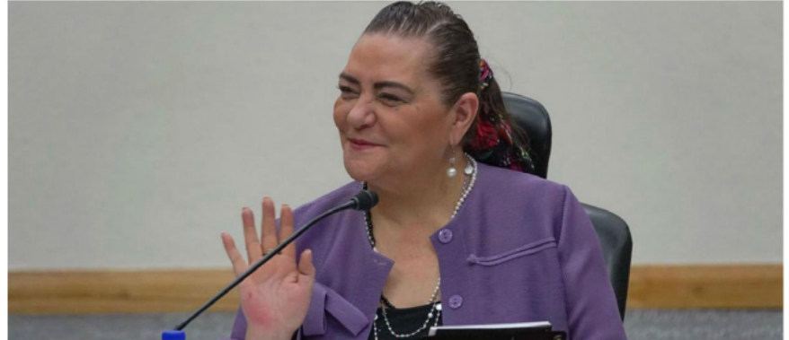
Para Guadalupe Taddei, es el procedimiento más importante que realiza el órgano electoral.

“Hoy nos encontramos en una etapa de la mayor importancia: con la asignación de las candidaturas a los cargos para elegir en cada distrito judicial electoral, según materia o especialidad. Este procedimiento