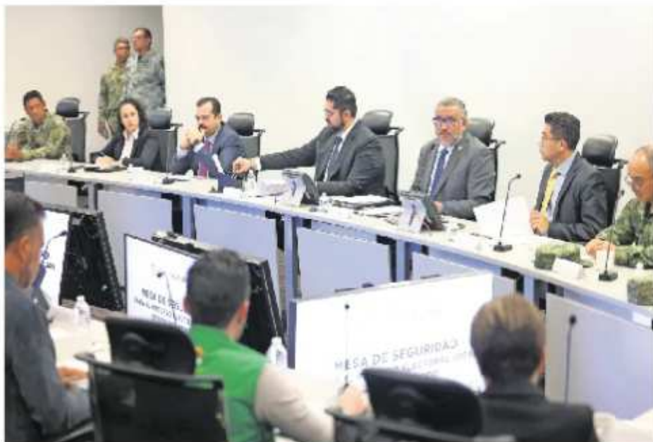
Autoridades estatales, del Ejército e integrantes de partidos políticos participaron en la mesa sobre seguridad en el proceso electoral.

podrían incidir en la seguridad de las personas que participen en el proceso electoral, el cual, junto con el protocolo de seguridad se mantendrá en constante actualización.