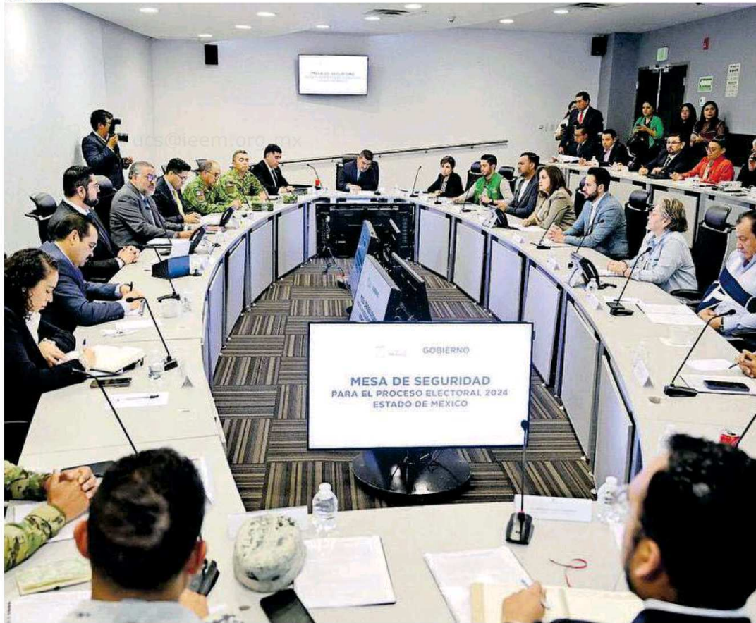
La reunión tuvo una duración de dos horas en las instalaciones del Centro de Control, Comando, Comunicación, Cómputo y Calidad (C5)