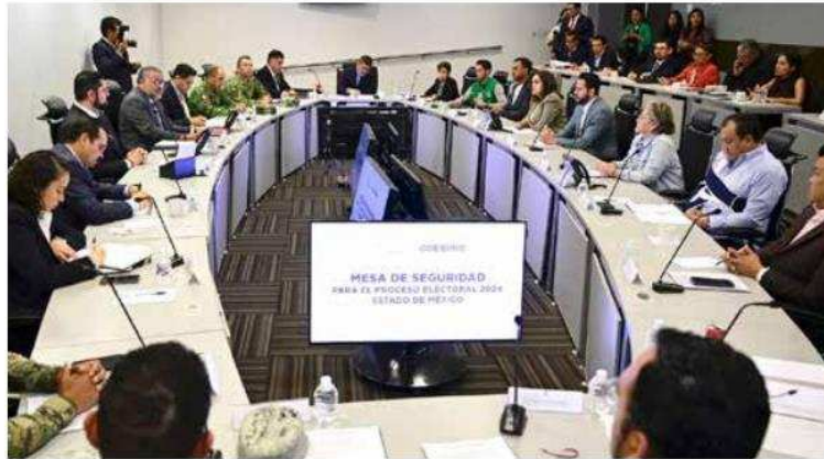
Mesa de Seguridad para el Proceso Electoral 2024

“Dependerá primero que los partidos o los candidatos pidan protección, si piden protección habrá un