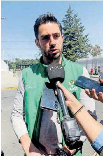
Dirigente estatal del PVEM