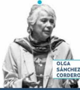
OLGA SÁNCHEZ CORDERO

► Por unanimidad, el Senado aprobó crear un Registro Nacional de Obligaciones Alimentarias, que incluya a todas las personas con adeudos de pensión a sus familias. Lo novedoso es que se les negará pasaporte, credencial de elector y licencia de conducir a quienes estén en esa situación, además de que no podrán contender por cargos de elección popular. Y la presidenta de la Comisión de Justicia, Olga Sánchez Cordero , celebró con bombo y platillo.