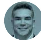
ALEJANDRO MORENO CÁRDENAS

► En los corrillos políticos se dice que el dirigente de MC, Jorge Álvarez Máynez , inició acercamientos con Claudio X. González , ex patrocinador de la alianza entre el PAN, el PRI y el PRD. La intención es explorar una coalición para la elección intermedia de 2027. También se dice que el senador panista Ricardo Anaya es el enlace.