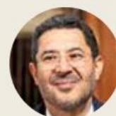
● Martí Batres

informara que Birmex (importador y distribuidor de medicinas y vacunas en tiempos de López Obrador ) tendría que aclarar el manejo de mil 44 millones de pesos. La Fundación nos entregó 110 hojas de contratos, convenios, comprobantes, comodatos, fotos de bienes adquiridos y hasta un cheque de 16 pesos que devolvió al ISSSTE como sobrante de los 5 millones. “Quisiéramos pensar que lo expuesto por el director del ISSSTE es falta de información