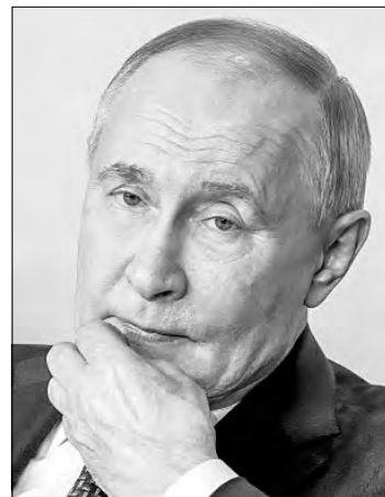
▲ Durante el Foro de las Tecnologías Futuras, llevado a cabo en Moscú el pasado viernes, el mandatario Vladimir Putin comentó que la labor futura de Elon Musk en las ciencias pudiera presentar oportunidades para Rusia.

http://alfredojalife.com https://www.patreon.com/alfredojalife https://substack.com/@jaliferahme https://www.facebook.com/AlfredoJalife https://vk.com/alfredojalifeoficial https://t.me/AJalife https://www.youtube.com/channel/UCIfxf0ThZDPL_c0Ld7psDsw?view_as=subscriber https://vm.tiktok.com/ZM8KnkKQn/ https://twitter.com/AlfredoJalife Instagram: https://instagram.com/alfredojalife?utm_source=qr (@alfredojalife)