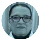
ROSA ICELA RODRÍGUEZ

► Nos cuentan que una instrucción precisa que se ha dado desde Palacio Nacional a todos los integrantes del gabinete es no engancharse con las provocaciones de Elon Musk , asesor del presidente de EU, Donald Trump . Es decir, tendrán oídos sordos ante sus declaraciones estridentes hacia nuestro país. Para que sepa que en México ni lo topan .