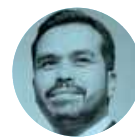
JORGE ÁLVAREZ MÁYNEZ

► Como ocurrió en la elección federal de 2024, ahora la Segob, a cargo de Rosa Icela Rodríguez , y la Secretaría de Seguridad, de Omar García Harfuch , otorgarán escoltas a los candidatos a puestos del Poder Judicial. Los aspirantes deberán solicitar la protección, que será evaluada, y a quienes lo ameriten por el grado de riesgo se les concederá.