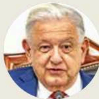
● Andrés Manuel López Obrador

¿Qué desgracia más grande puede testimoniar un país que la muerte de sus niños, niñas y jóvenes? Cuando esas muertes son producto de homicidios, la desgracia deviene en tragedia. El Inegi difundió ayer la estadística de defunciones en el primer semestre del año pasado, último semestre completo de López Obrador . La primera causa de muerte de los mexicanos entre 25 y 44 años fueron los asesinatos (7 mil 887, promedio de 43 cada día) y entre los niños y muchachos de 15 a 24 años fue la segunda (3 mil 30 casos, promedio de 17 diarios). Cada día de enero a junio de 2024, 10 mil 917 personas fueron ultimadas en la plenitud de sus vidas: 10 mil 917 jóvenes en un semestre. Tragedia. El gobierno de López Obrador optó por no enfrentar a los grupos generadores de violencia, grandes o pequeños, y dejó a la población a su suerte. Ahí están las consecuencias fatales de un gobierno “humanitario” de palabra y criminalmente indolente en la obligación de darle paz y seguridad a los mexicanos, a los jóvenes. Pero como la elite de la 4T es un club en donde no se pide cuentas a los socios, menos al fundador, él podrá seguir escribiendo y cavilando tranquilo en su escondite.