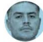
OMAR GARCÍA HARFUCH

► Después del informe por los 100 días de gobierno de Clara Brugada , este domingo, todas y todos los integrantes de su gabinete legal y ampliado realizarán asambleas informativas. Fue la instrucción de la jefa de Gobierno, y contemplan unas 200, para difundir los proyectos, programas y estrategias implementadas en su gestión.