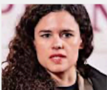
Presidencia Luisa María Alcalde Secretaría de Gobernación.

Durante el Congreso Nacional de Morena se renovarán los siguientes cargos, y estos serían los posibles titulares: