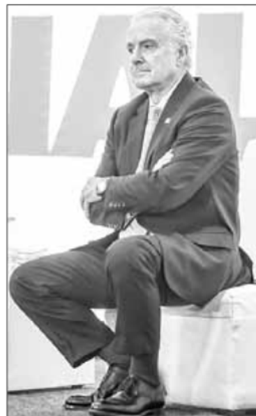
▲ Todo parece indicar que al panista Santiago Creel se le fue la última oportunidad de cumplir su sueño de ser presidente de la República.

Facebook, Twitter: galvanochoa Correo: galvanochoa@gmail.com