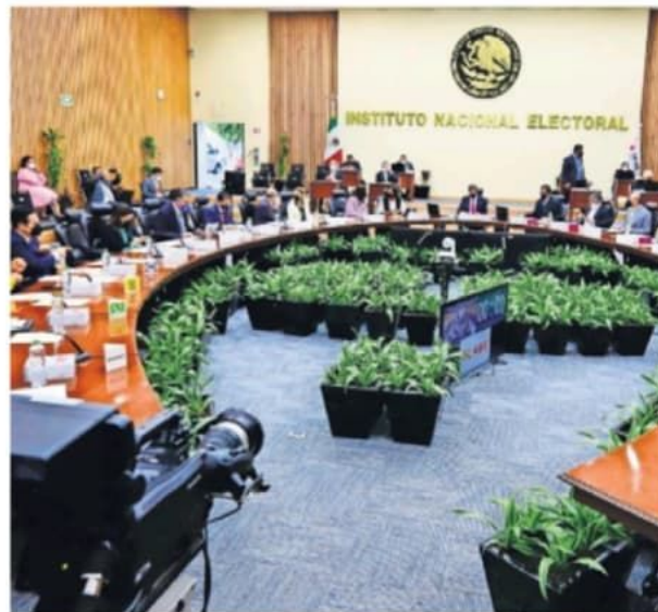
Este lunes, el Consejo General del INE votará en el pleno a favor de otorgar a los partidos políticos más de 6 mil millones de pesos para las elecciones de 2023.

“Los recursos de los partidos políticos nacionales y locales (para) sus actividades ordinarias tendrán origen exclusivamente en aportaciones de personas físicas”