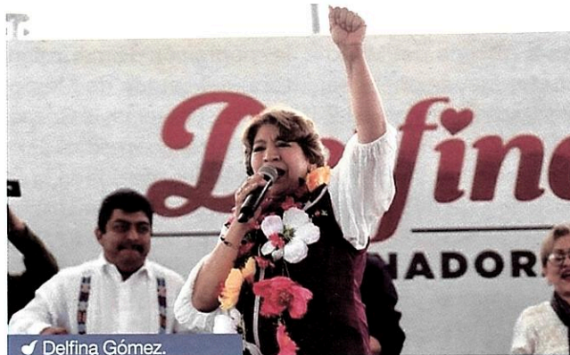
✓ Delfina Gómez.