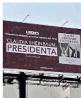
■ Los panorámicos con la imagen de Sheinbaum aún se exhiben en la CDMX.

"Desde hace rato nosotros hemos pedido que los bajaran y está bien que intervenga el Presidente", dijo Sheinbaum la semana pasada en una entrevista.