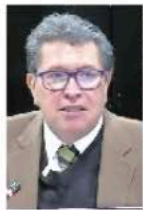
Ricardo Monreal Ávila

::::: Nos recuerdan que las corcholatas van a ganar, aunque pierdan, es decir, los cinco que no sean elegidos para ser el candidato presidencial de Morena, tienen "hueso" asegurado.