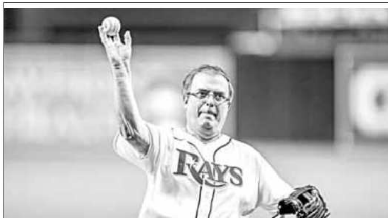
▲ El canciller Marcelo Ebrard en el lanzamiento ceremonial del partido de beisbol entre los Rays de Tampa Bay y los Cervecedores de Milwaukee en Florida.

Facebook, Twitter: galvanochoa Correo: galvanochoa@gmail.com